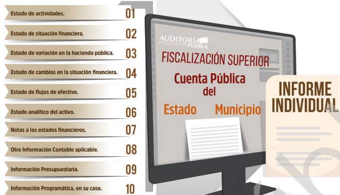
Diagrama 2 Enfoque a Procesos de la Fiscalización Superior 2017